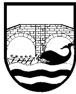
ONDARROAKO UDALA Bizkaia